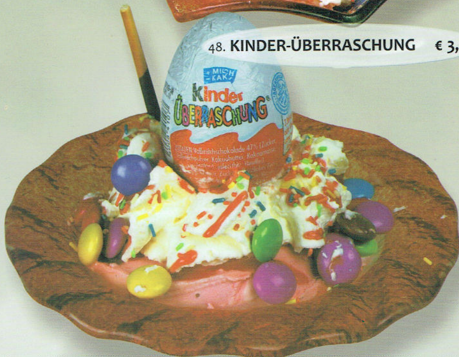
48. KINDER-ÜBERRASCHUNG € 3,40