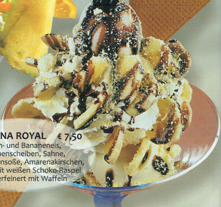
51. BANANA ROYAL € 7,50 Milch- und Bananeneis, Bananenscheiben, Sahne, Schokoladensauce, Amarenakirschen, garniert mit weißen Schoko-Raspel und verfeinert mit Waffeln