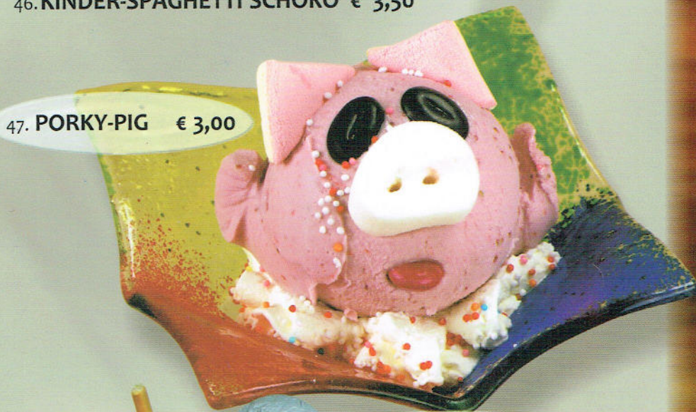
47. PORKY-PIG € 3,00