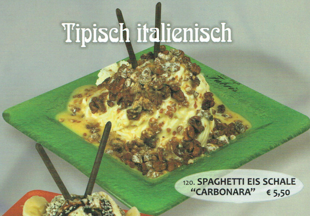
120. SPAGHETTI EIS SCHALE "CARBONARA" € 5,50