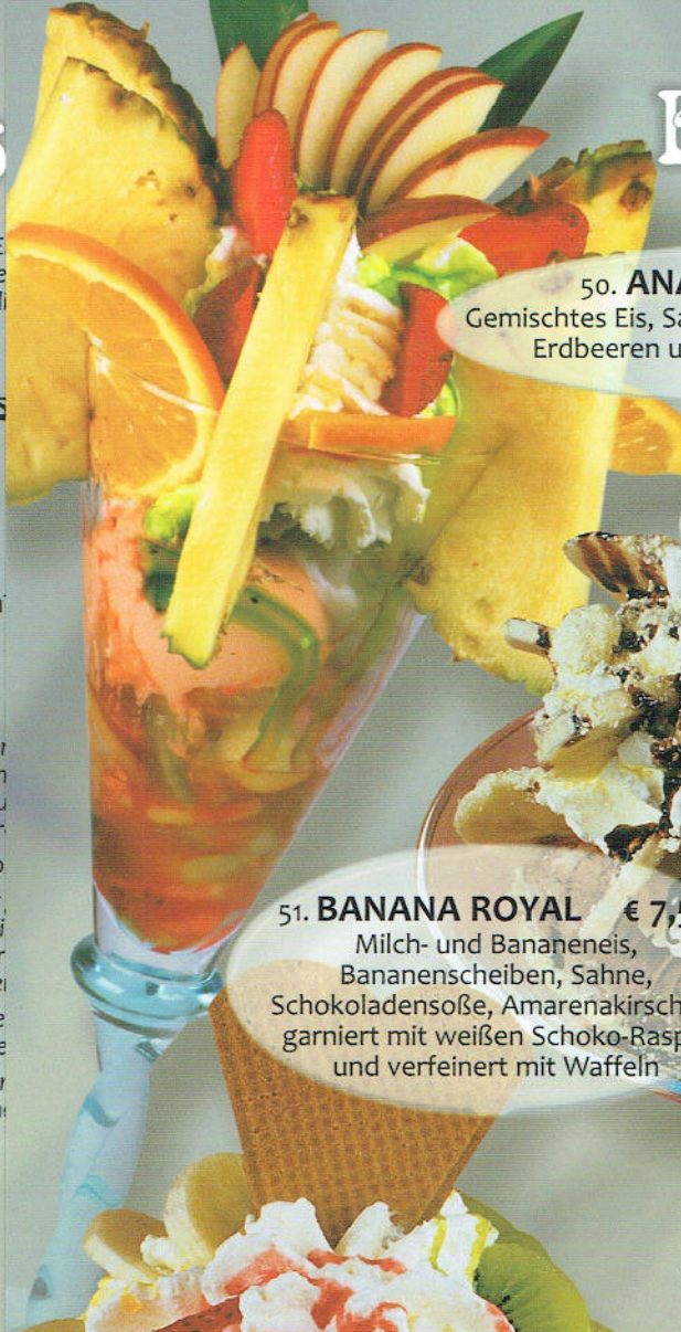
50. ANANAS TRAUM € 8,00 Gemischtes Eis, Sahne, Ananas, Pfirsich- und Kiwistücke, Erdbeeren und Weintrauben, abgerundet mit Soßen und Waffeln