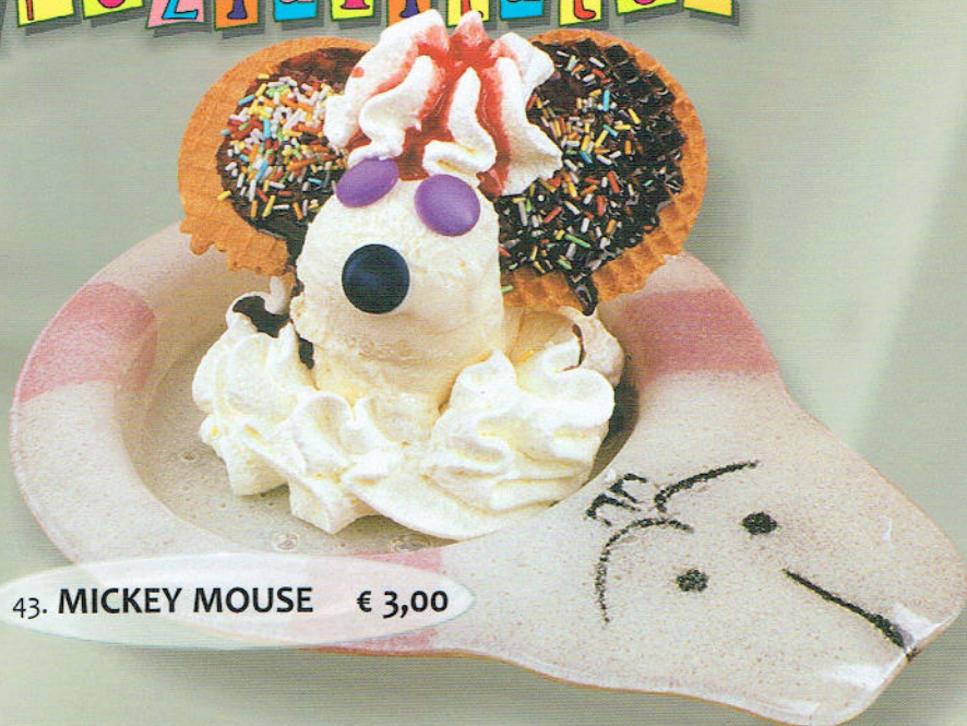
43. MICKEY MOUSE € 3,00