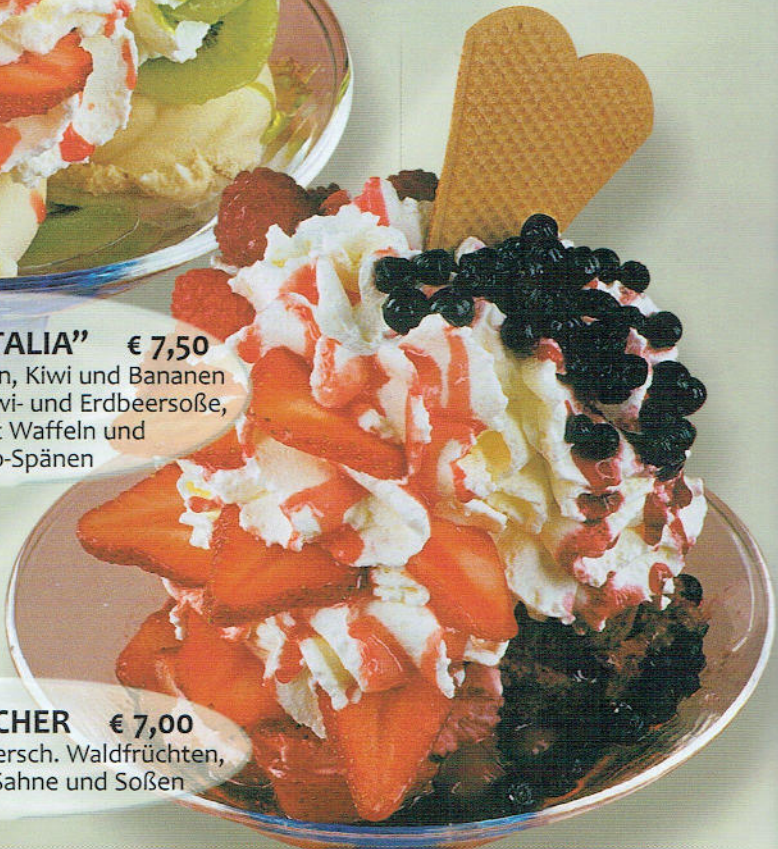
57. WALDBECHER € 7,00 Cremiges Eis mit versch. Waldfrüchten, verfeinert mit Sahne und Soßen