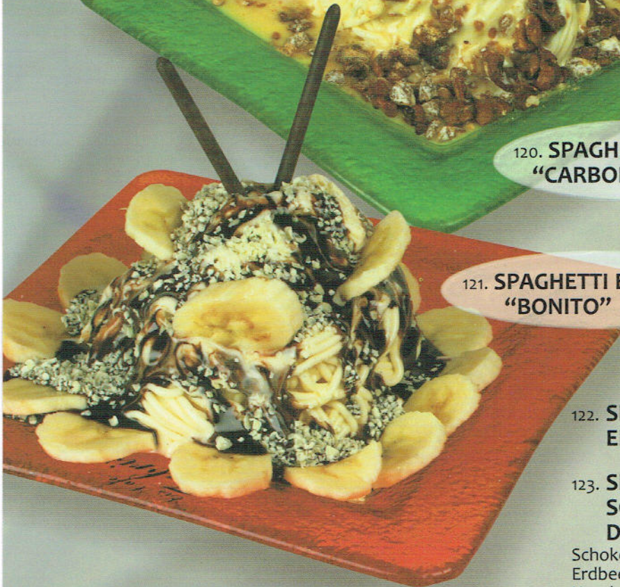
121. SPAGHETTI EIS SCHALE "BONITO" € 5,50